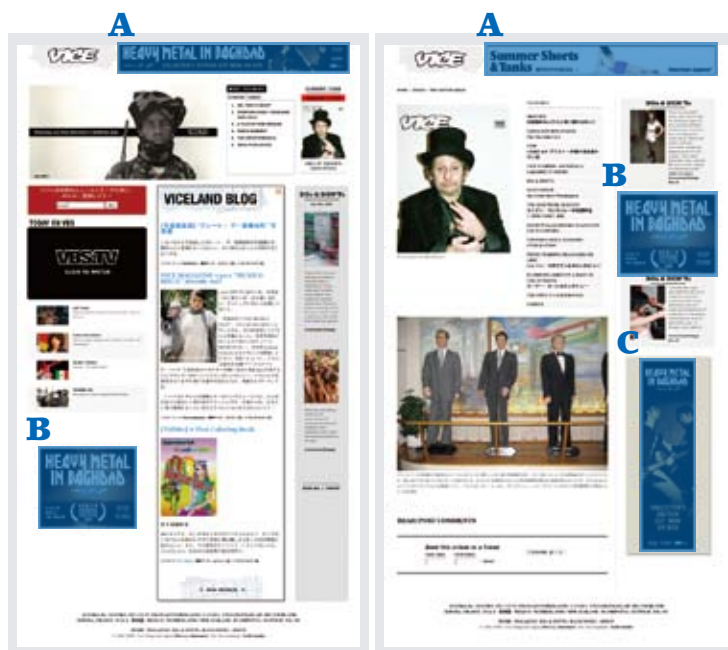
A : ヘッダーバナー B : サイドバナー C : フッターバナー