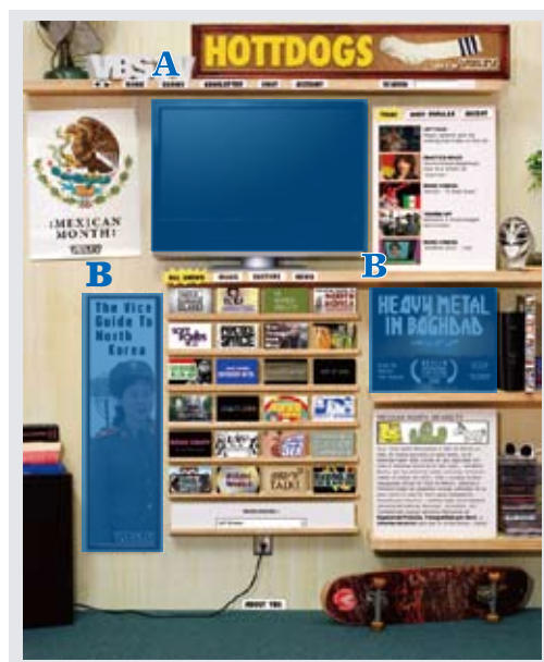
A : プレロールビデオ (動画) A : オンスクリーン (静止画) B : サイドバナー

記載金額は、2 万回表示 (月) あたりの料金です。 表示回数は参考であり、それを保証するものではありません。 料金は、すべて税抜きの金額になります。